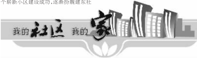
□晚报记者 陈星羽 文/图

区。 建东社区的蜕变不仅体现在硬件上,社区的文化建设、人文关怀也在悄然改变。 社区 11 名工作人员与辖区 80 户困难群众结成“一带多”帮扶对子,先后为数十名下岗失业人员办理了失业证,为两名失业人员办理了小额贷款,帮助 5 名无业人员实现再就业。 一个美化、绿化、亮化、净化,而且富有文化色彩的新型社区,已经成为周口中心城区一颗闪耀的新星。