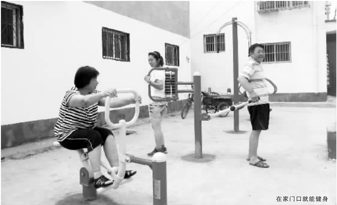
在家门口就能健身

后,但它四邻市区主干道,辖区附近拥有大型商贸城、菜市场 and 行政核心区,以及职业培训学校,具备得天独厚的区位优势,要跟上中心城区的建设步伐,建东社区潜力很大。”小桥办党委书记王红卫介绍,该办事处在不大动干戈的基础上,采取拆除违建、疏通道路;科学规划、整体装饰;文化覆盖、营造氛围等方式,在最短的时间内就把建东社区变了样。 主干道全部硬化、绿化,大街小巷干净整洁,临街墙体粉刷一新,创建标语内容广泛,健身小广场就在居民家门口……走进建东社区,一股清新之风扑面而来。 出行难是头号问题。建东社区通过群众代表大会决议,坚持“一事一议”,采取上边争一点、集体拿一点、群众集一点的办法,共筹措资金 130 万元,硬化小巷 17 条,总长 3200 米,硬化面积 1.2 万平方米,安装路