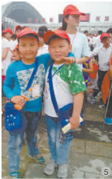
图(1)徒步行进中 图(2)小记者签名留念 图(3)小记者方队 图(4)小记者接受采访 图(5)接伴而行