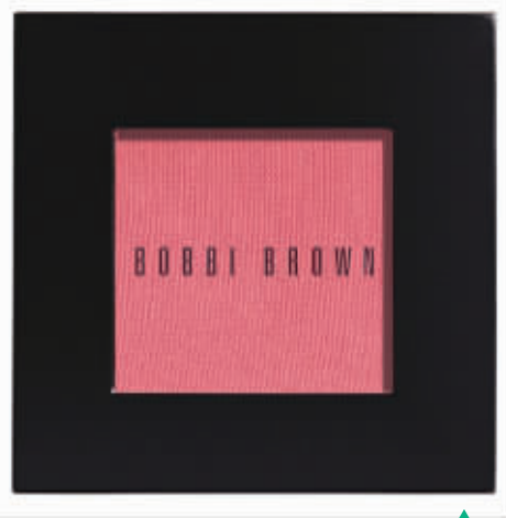
BOBBI BROWN 漾香胭脂 blush 3.2g/250 元