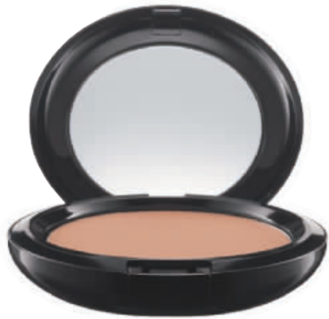
M.A.C 魅可妆前美颜防晒底霜 SPF30 PA++ 8g/350 元