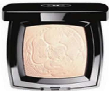
香奈儿山茶花园亮颜粉 新品未定价