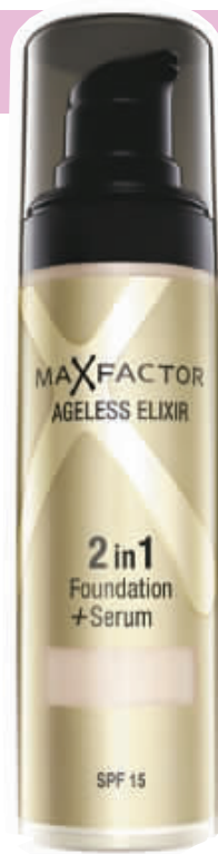
Max Factor 蜜丝佛陀双效盈润修护粉底液 30ml/178 元