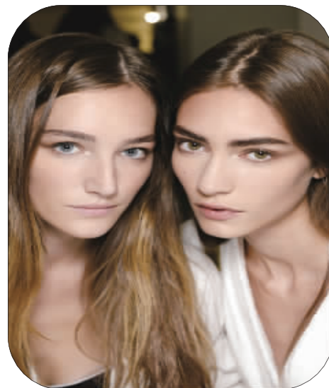
Calvin Klein 2014 春夏系列妆容重在打造自然美肤,“眉毛部分不多加修饰,以呈现出天然无雕琢的原始之美。”ck one 全球彩妆大师 Jodie Boland 这样描述妆容灵感。