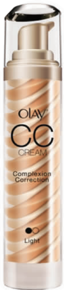
Olay 活颜隔离修饰乳霜 50g/260 元

化极简妆应注意面部肌肤修饰,细腻无瑕、水润透亮的肌肤质感是妆容重点,只有这样才能真正实现化繁为简。此外,还要避免脸部出现太多色系,亮点只在一个局部呈现即可,如唇部或眼部。色彩建议选择金属色系或大地色系,着装风格则很广,因为极简妆容很百搭。