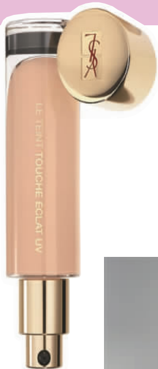
YSL 圣罗兰明彩恒妍粉底液 SPF30/PA +++ 30ml/570 元