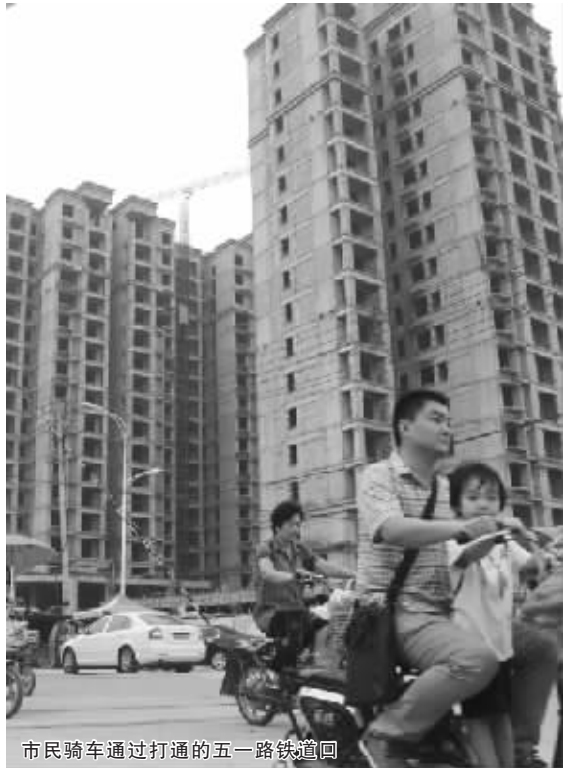
市民骑车通过打通的五一路铁道口

据悉,该市场被命名为五一路菜市场,建筑面积 2200 平方米,投资 400 万元。市场内设置瓜果蔬菜区、熟食小吃区、鸡鱼市场区,并建设有停车场、管理房、厕所和雨污水管网等配套工程。预计今年 7 月份动工开建。