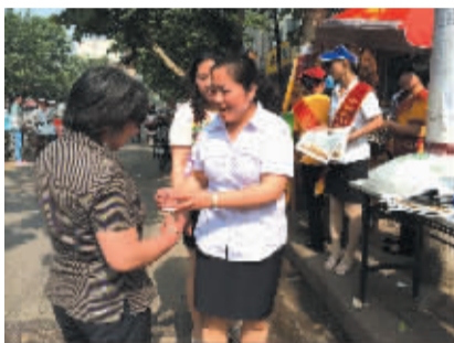
太平洋寿险郸城支公司负责人为考生家长送去“夏日清凉”。