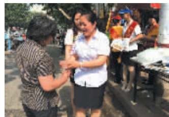
太平洋寿险郸城支公司负责人为考生家长送去“夏日清凉”。