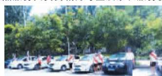
高考爱心车队列队准备出发。