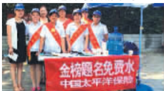
太平洋寿险淮阳支公司高考站点服务人员真诚为考生及家长服务。