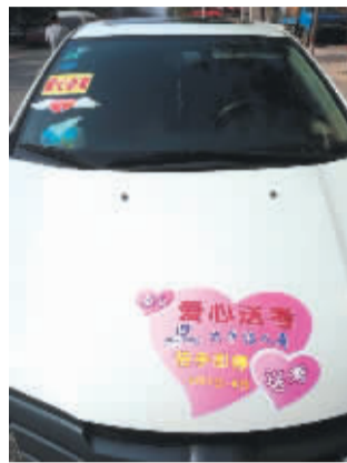
太平洋寿险周口中支爱心车队的统一标志。