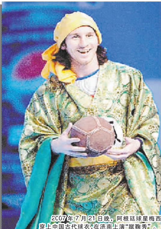
2007年7月21日晚,阿根廷球星梅西穿上中国古代球衣,在济南上演“蹴鞠秀”。