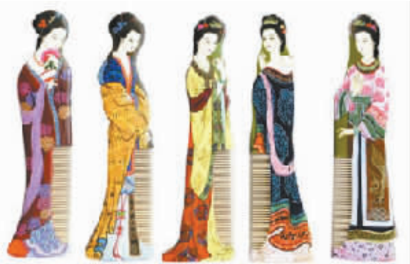
经过艺术加工的篦子发饰