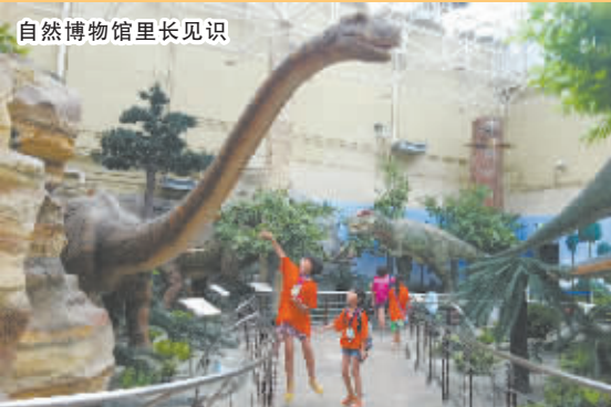
自然博物馆里长见识