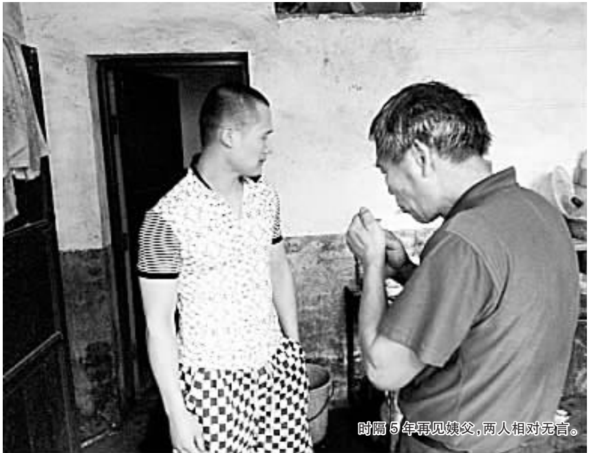
时隔 5 年再见姨父,两人相对无言。