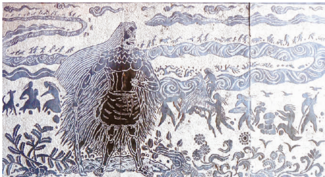
淮阳太昊陵内的伏羲圣迹图

在淮阳这座古城,我们放慢了采访的脚步。因为从淮阳到天水,将是一次漫长的文化之旅,也是一次文化苦旅。我们之所以把淮阳作为起始点,是因为伏羲文化的光芒是从这里传播出