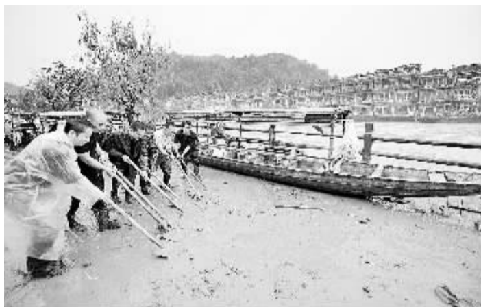
7月17日,凤凰当地群众在沱江沿岸清理淤泥杂物。

随着雨势减弱,湖南凤凰古城内局地洪水已逐渐消退,之前被淹的商铺开门清理淤泥和杂物,救援人员也同时对街道进行清淤和消毒。