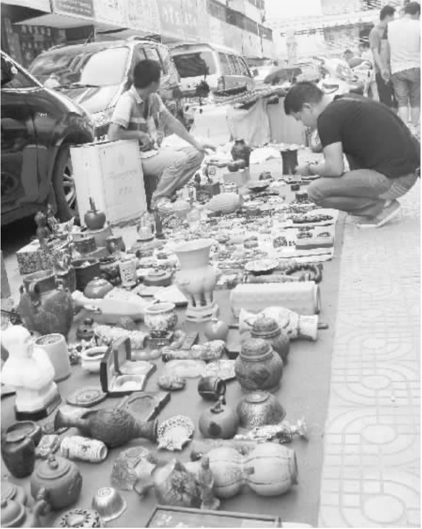
男人街女人街每周五的书画古玩市场

况下，收藏家协会有责任和义务承担起周口收藏事业发展的使命，培育出自己的市场来，早日实现产业化。 实现收藏产业化的关键环节是打造产业链，而产业链的核心构建是产、供、销。在