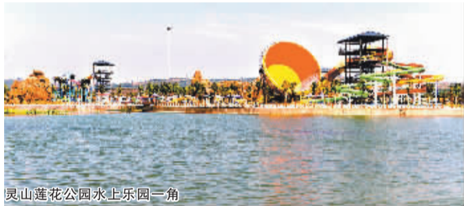
灵山莲花公园水上乐园一角