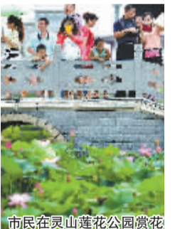
市民在灵山莲花公园赏花