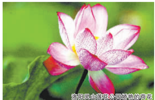
洛阳灵山莲花公园娇艳的荷花