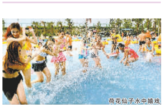
荷花仙子水中嬉戏