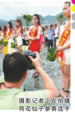
摄影记者正在拍摄荷花仙子参赛选手