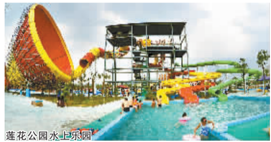
莲花公园水上乐园