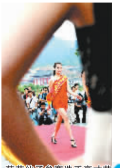
荷花仙子参赛选手亮才艺