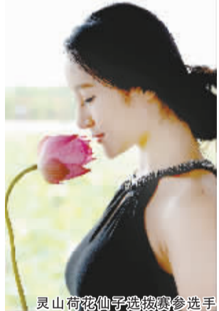
灵山荷花仙子选拔赛参选手