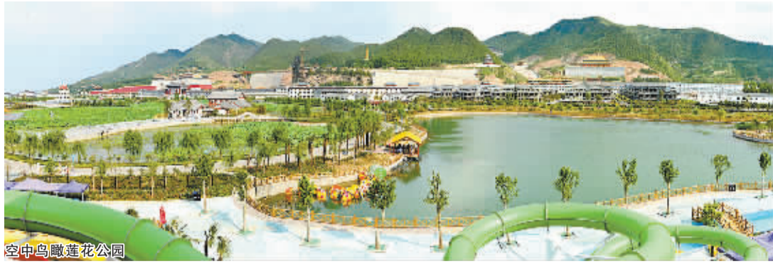
空中鸟瞰莲花公园