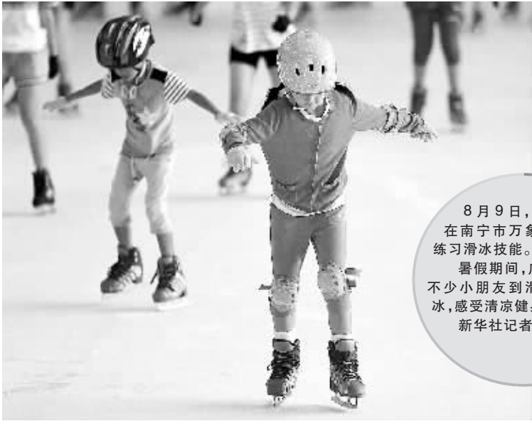
8月9日，小朋友在南宁市万象城滑冰场练习滑冰技能。 暑假期间，广西省南宁市不少小朋友到滑冰场学习滑冰，感受清凉健身的乐趣。

到期的校舍等。 我省强调，各级教育行政部门和学校要建立健全汛期预警体系和预案，落实人员和物资保障；要切实落实学校安全值班制度，保证信息渠道畅通。学校有危房而不报告的，责任在学校校长和中心校校长；学校报告而没有及时得到维修改造的，责任在县级政府；造成校舍安全责任事故的，将严肃查处，并追究领导责任和相关部门的责任。 （李见新）