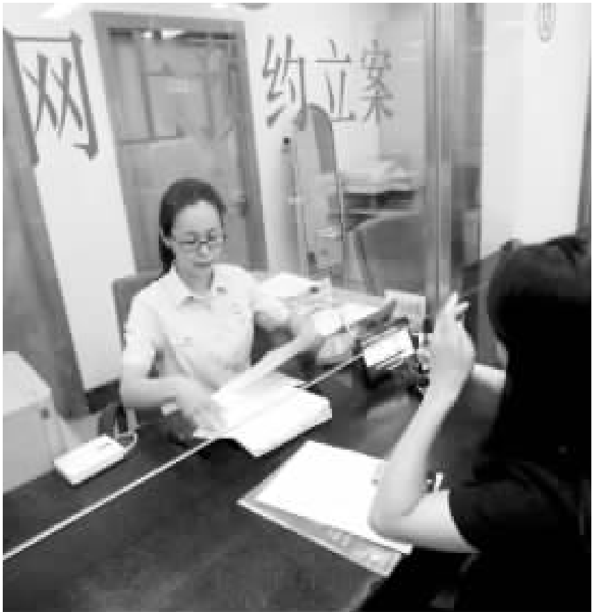
8 月 12 日,当事人在朝阳法院立案大厅“网上预约立案”窗口办理立案。

陈立如庭长告诉记者,8 月底,执行依据为仲裁裁决书、仲裁调解书、公证债权文书等案件亦会纳入到可预约立案的范畴。此外,北京法院还将积极探索特定类型案件(如执行类案件)的网上直接立案模式,以及网上支付功能,届时当事人或者代理人将不需要到法院办理立案手续,真正实现远程立案。