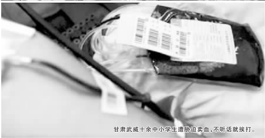
甘肃武威十余中小学生遭胁迫卖血，不听话就挨打。