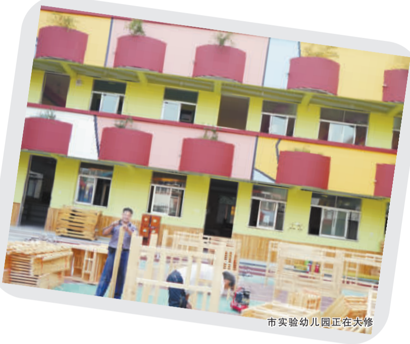
市实验幼儿园正在大修

据了解，根据省综治办、教育厅、公安厅出台的相关文件，对学校“三防”设施配备制定了详细的标准，其中包括安保人员的数量、条件、装备；消防设施的配备、照明及应急灯的配备以及公路沿线学校交通安全提示设施设置等等。目前我市各级教育部门正在根据相关标准，为校园增添安全保障。