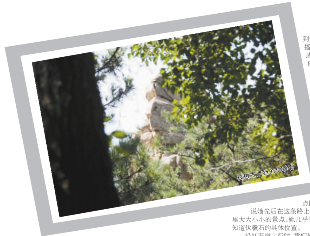
被树木遮挡的伏羲石

这次,我们从300多公里外的河南来到这里,就是为了寻找伏羲时代的先民播迁到这里,曾在这里留下的遗迹、足迹或只言片语。想到这些,我们立刻信心倍增。