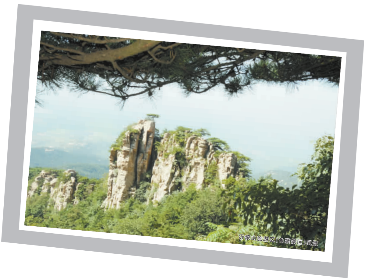
沂蒙山旅游区(龟蒙景区)风景