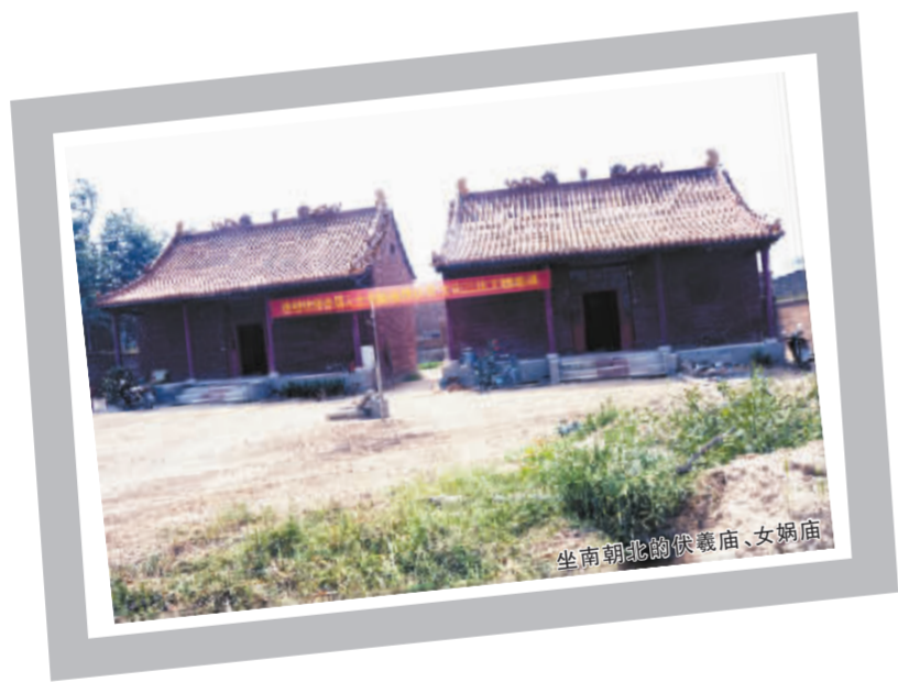
坐南朝北的伏羲庙、女娲庙