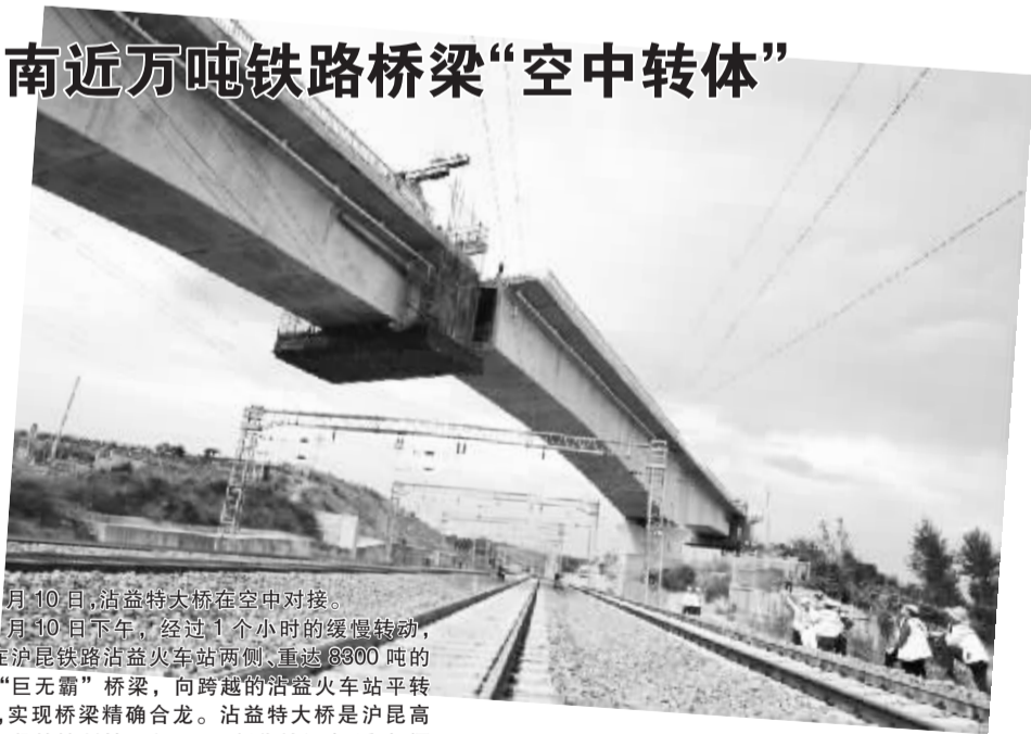
9月10日,沾益特大桥在空中对接。

9月10日下午,经过1个小时的缓慢转动,矗立在沪昆铁路沾益火车站两侧、重达8300吨的“巨无霸”桥梁,向跨越的沾益火车站平转25.3°,实现桥梁精确合龙。沾益特大桥是沪昆高铁云南段的控制性工程。