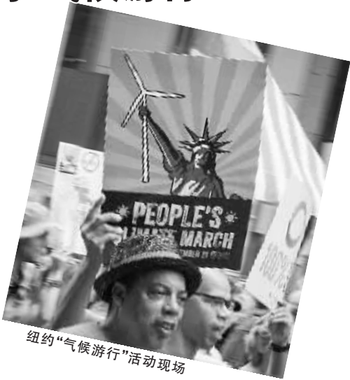
纽约“气候游行”活动现场

新华社纽约 9 月 21 日电（记者 顾震球）联合国秘书长潘基文 21 日在联合国总部所在地美国纽约市与数十万民众共同参加了大规模的气候游行活动，以敦促国际社会加紧应对气候变化。 据主办方初步统计，当天游行活动的参与人数达到 31 万人，创历史纪录。潘基文、纽约市长比尔·德布拉西奥和美国前副总统戈尔等众多国际知名人士也都一同参与。 潘基文当天头戴印有联合国徽记的蓝色棒球帽，身穿带着气候峰会标志的白色 T 恤来到游行队伍中间，接受了一个装着广大民众对气候变化问题诉求的纸箱子。 潘基文表示，积极应对气候变化的行动“没有备选方案”，因为人类赖以生存的地球“没有备份”。 当天的活动从纽约市著名的中央公园西侧开始，大部分参与民众步行，也有不少骑着自行车或者坐着轮椅参加。活动过程中，还有人演奏手风琴等乐器助兴。 12 岁的玛丽亚·博罗赞说：“这个世界对我很重要，我想要保护环境。”另一位成年游行说，在应对气候变化方面，留给我们的时间并不多，因此我们必须尽快采取有效行动，为子孙后代留下一个永远宜居的地球。 据报道，全球 166 个国家的民众响应号