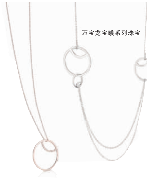
万宝龙宝曦系列珠宝