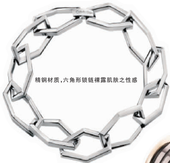
精钢材质, 六角形锁链裸露肌肤之性感