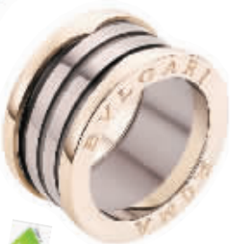
宝格丽 B ZERO1 ROMA 戒指