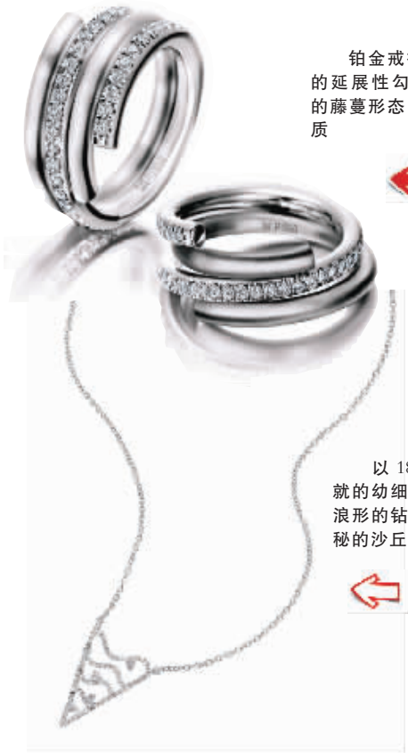
铂金戒指, 利用铂金的延展性勾勒自然柔和的藤蔓形态, 彰显温婉气质