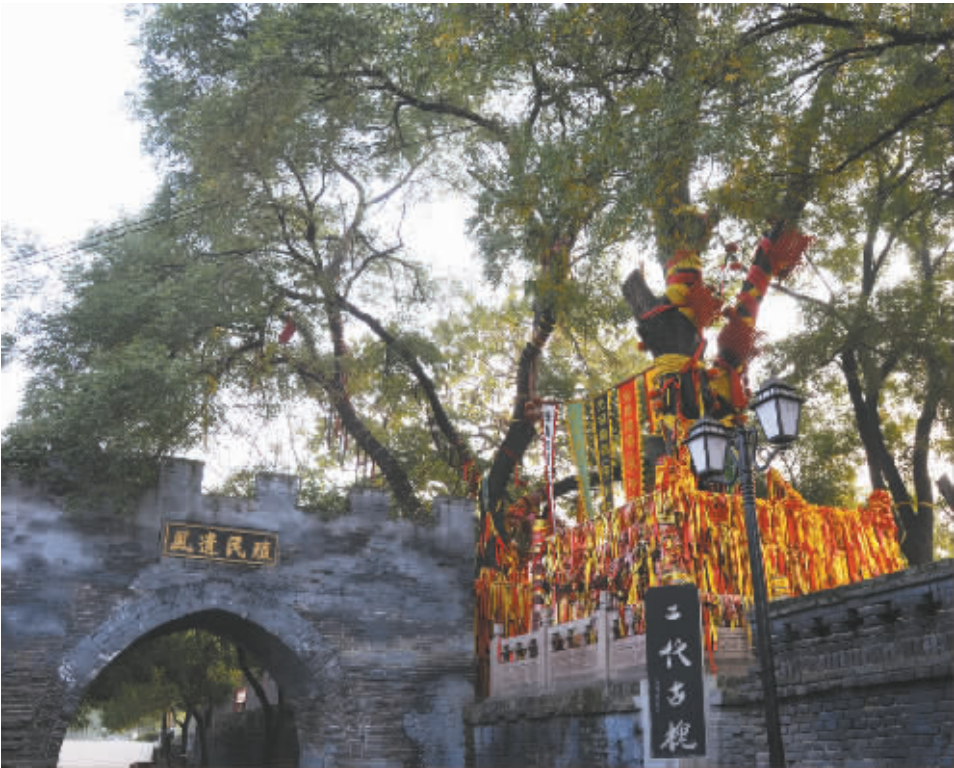
枝繁叶茂的二代古槐树

在“大槐树寻根祭祖园”,我们了解到,明代的古大槐树,早已被汾水冲毁,但作为移民的见证、怀祖的寄托,洪洞县于民国三年在古大槐树处修建了碑亭,亭虽不大,但雕梁画栋,飞檐斗拱,精巧玲珑。在碑亭斗拱下方,还雕刻有伏羲、神农、黄帝的雕像。亭内竖青石碑一座,刻有“古大槐树处”五个大字。亭子一侧,后栽的二代、三代大槐树枝繁叶茂,浓荫遮地。多年来,来自全国各地的移民后裔来这里寻根祭祖。1991 年,洪洞县顺应广大槐树移民后裔回乡祭祖的意愿,举办了首届“洪洞大槐树寻根祭祖节”。并将此后每年的 4 月 1 日至 10 日确定为“寻根祭祖节”。同时,对原大槐树移民遗址实施了全方位开发建设,建设了占地面积 300 多亩的“大槐树寻根祭祖园”。园内建筑规模宏大,主题