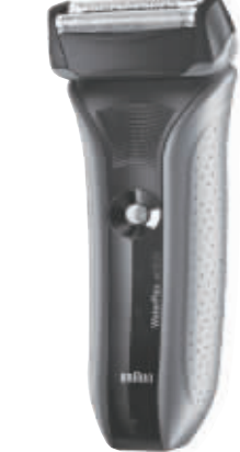
德国博朗水感剃须刀 德国博朗 WaterFlex 水感剃须刀 33 度旋转剃须刀头设计,可根据用户面部轮廓差异,自动调整角度。