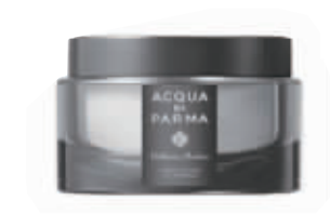
帕尔玛剃须膏 帕尔玛之水剃须膏具有高分子量透明质酸,能对皮肤形成一个有效的保护屏障。

飞利浦 75 周年珍藏限量版 24K 黄金须刀特有 24K 镀金手柄设计,纯手工荷兰打造。