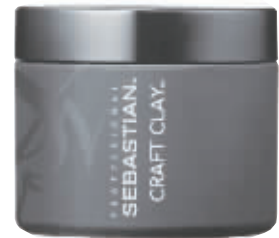
塞巴斯汀随心所欲发泥 富含天然矿物成分,重组秀发纹理。