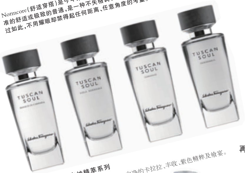
菲拉格慕托斯卡纳精萃系列 创意及精选的香氛成分来自于:白净的卡拉拉、丰收、紫色精粹及飨宴。

Noncore(舒适穿搭)是今年来自《纽约时报》的一个新造时尚词汇,译为标准的舒适或极致的普通,是一种不失格调、平凡却自在的状态。魅力型男不过如此,不用耀眼却禁得起任何距离、任意角度的考量。