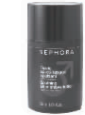
丝芙兰男士修护须后乳 丝芙兰男士修护须后乳有效减少成分中的细菌和真菌,舒缓须后皮肤,为肌肤带来更多保护。