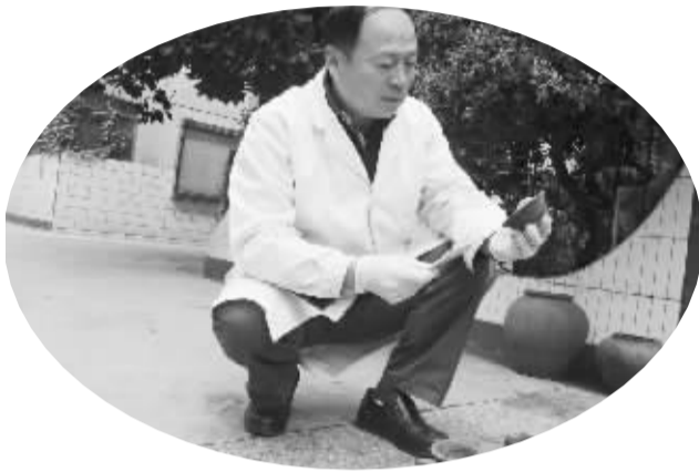
技术人员拣选出土的陶器

行文物清理时,周口市文物考古管理所技术人员意外发现了3枚新莽时期的铲币货布,这在我市尚属首次。