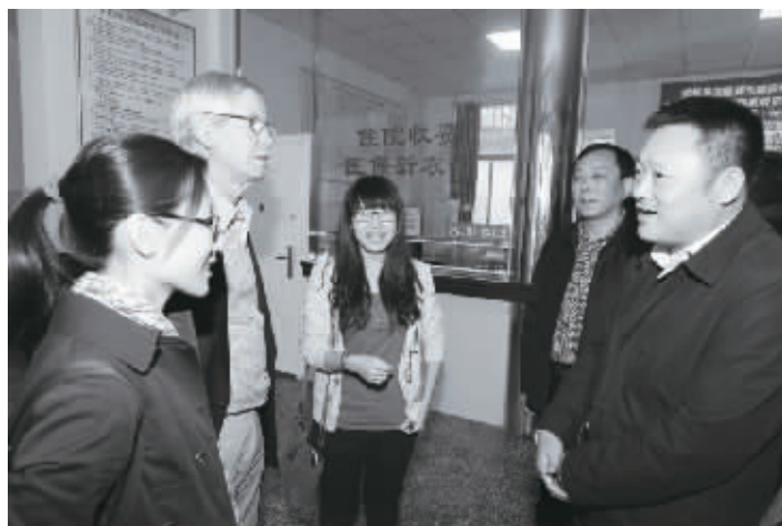
市卫生局局长、党组书记郝宝良与眼科专家们亲切交流。