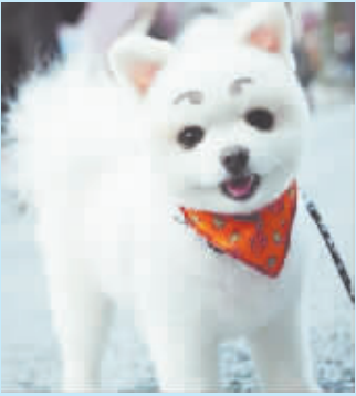
狗狗还是猫猫,傻傻分不清

去面馆吃面,刚坐下就过来一人,手里拿着一张几何图案的图片,图片中心有个红点。那人对我说:“现在,盯着这个红点看 20 秒,然后闭上眼睛,就会有奇迹出现。”我盯着看了 20 秒,闭上眼睛却没看见什么奇迹,气得我睁开眼。奇迹真出现了:桌子上我的手机不见了。