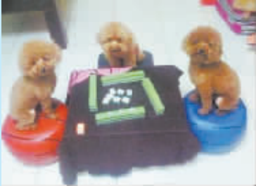
三缺一,多么痛的领悟