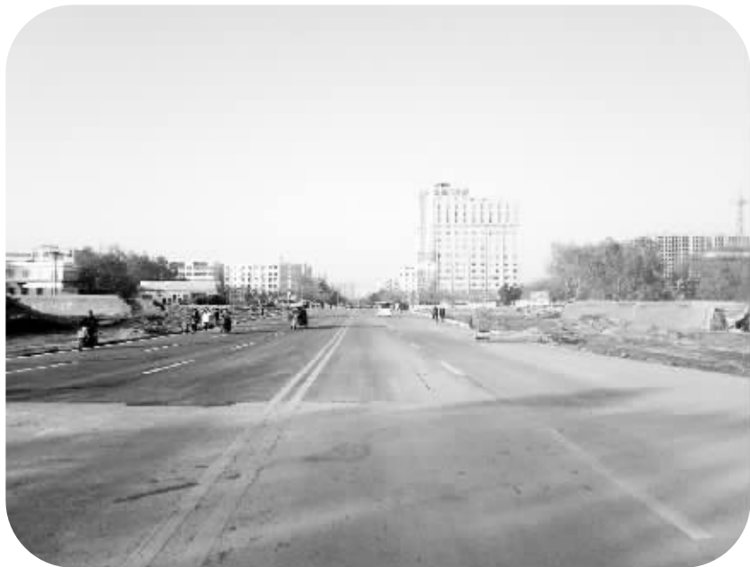
八一大道南北贯通现场

在周口市中心城区,一条铁路从城市的西南方向进入市区,穿过市区的中南部,再从城市的东南方向离开市区。随着城市不断发展,城区面积不断扩大,以前处于城市南部边缘的这条铁路如今被夹在城市中间。在 2014 年 1 月底之前,在市区环城路以内,仅有工农路和中州大道两个道口能供行人和机动车通行,市民出行非常不便,一条铁路把城市“分割”成两部分。