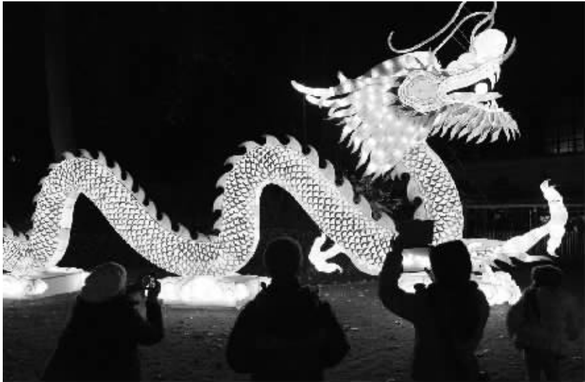
12 月 6 日，在比利时安特卫普动物园，游客在一个长达 40 米的中国龙花灯前拍摄。 当日，安特卫普动物园“中国灯之动物园”花灯展开序幕。本次花灯展将持续一个半月，展出来自四川自贡的近 30 组花灯。这是中国花灯首次来到比利时展出。