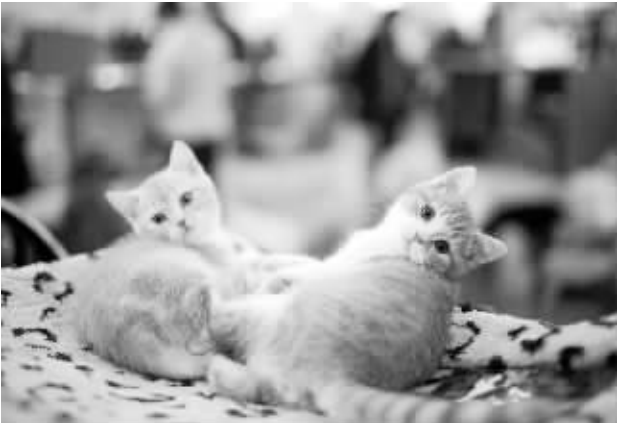
12 月 6 日，在俄罗斯首都莫斯科举行的国际猫展上，两只小猫回头张望。 当日，莫斯科全俄展览中心举行为期两天的国际猫展，共有数十个品种超过 2000 只猫咪参展。