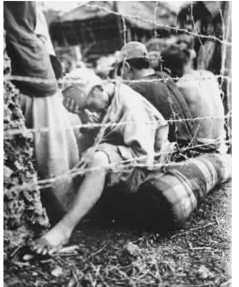
1945年被日军俘虏的士兵

美国女作家劳拉·希伦布兰德历时7年,前后75次采访赞佩里尼,大量翻阅资料,还原了一段尘封65年之久的记忆,成就了“感动整个美国的励志巨著”《坚不可摧》。该书2010年在美国出版后即引起轰动,畅销百万余册,长居《纽约时报》图书畅销榜,还被《时代周刊》和《出版商周刊》评为2010年非虚构类书籍十强。好莱坞影星安吉丽娜·朱莉也是赞佩里尼众多仰慕者中的一位,2013年她担任影片导演,将这个故事搬上银幕。《坚不可摧》由美国环球影业拍摄,真实反映了赞佩里尼这段不寻常的心路历程,揭示出个人命运在大时代背景中的跌宕起伏。