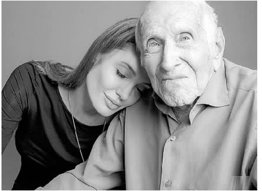
安吉丽娜·朱莉与电影主人公原型路易斯·赞佩里尼

美国好莱坞影星安吉丽娜·朱莉指导的电影《坚不可摧》即将于圣诞节在北美地区上映。谁料,这部二战题材影片还未公映,便在日本受到抵制。一些日本右翼人士指责影片过分夸大主人公在被日军俘虏期间所遭受的虐待,甚至呼吁在日本国内“封杀”朱莉。