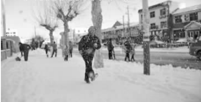
12月16日,山东烟台栖霞一名小学生在雪地上开心玩耍。