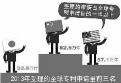
2013年受理的全球专利申请量前三名