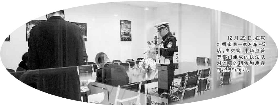
12月29日,在深圳香蜜湖一家汽车4S店,由交警、市场监管等部门组成的执法队对该店的销售和库存情况进行统计。

期,对违反禁行规定的机动车只做警告处理。缓冲期后由公安机关交通管理部门依照有关规定处理。”