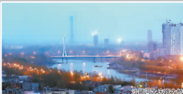
沙颍河大庆路大桥