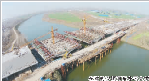
在建的沙颍河东外环大桥