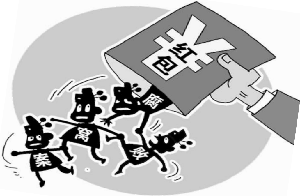
朱慧卿 作