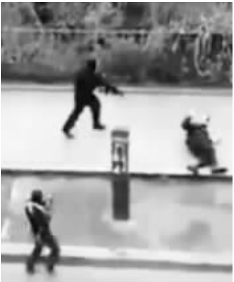
视频显示，枪手杀害了一名倒地的警察。

法国巴黎《沙尔利周刊》杂志社 2015 年 1 月 7 日遭一伙武装人员持冲锋枪和火箭炮袭击，导致包括周刊主编在内的至少 12 人中枪死亡。 警方说，武装人员已逃离现场，目前尚不清楚他们的身份。 事发后，法国总统弗朗索瓦·奥朗德赶往现场，把这起事件定性为恐怖袭击。法国政府已确认枪手共有 3 名。