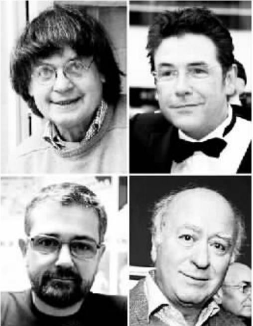
部分遇害的杂志社工作人员。

《沙尔利周刊》创建于 1970 年，2012 年在法国发行量已达 4.5 万份。该周刊以刊登讽刺性漫画著称，先前多次因刊登政治和宗教人物漫画引发争议。 2011 年 11 月，《沙尔利周刊》封面刊登内容涉及先知穆罕默德的漫画，招致宗教人士不满。随后，这家杂志社遭炸弹袭击。《沙尔利周刊》主编斯特凡·沙博尼耶多次收到死亡威胁，并因此生活在警方保护之下。