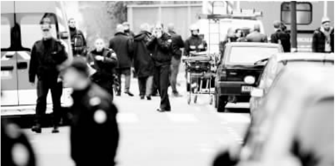
警方已经完全封锁了事发街区。巴黎已经将警戒级别提升至最高级。

据法国媒体报道，这是法国本土 40 年来遭遇的死亡人数最多的恐怖袭击。目前，尚无任何组织宣称对该事件负责。 事发后，法国总统奥朗德赶往袭击现场，他在现场说：“这无疑是一起恐怖袭击。”他说，法国近几周已经挫败了几起恐怖袭击图谋，法国将加强警戒，防止此类袭击再次发生。奥朗德还呼吁全国团结一致，并要求保护所有可能遭受类似袭击的地点。当地时间 14 时，法国政府将在爱丽舍宫总统府召开部长级会议。 法国总理府说，最高反恐级别将扩大至巴黎大区范围，安全机构将加大对新闻机构、大型商场、交通车站和宗教场所的保护力度。 法国警方已在街头部署了约 3000 名警力捉拿袭击者。此外，警方已经在巴黎东北部的 19 区附近发现了袭击者逃跑时所乘坐的汽车，并开始对该辆车进行检验。