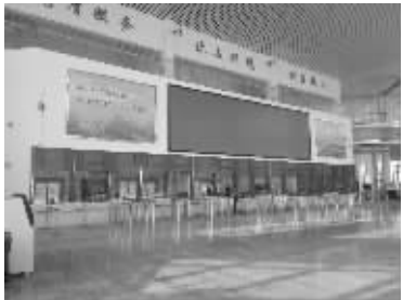
售票大厅宽敞明亮