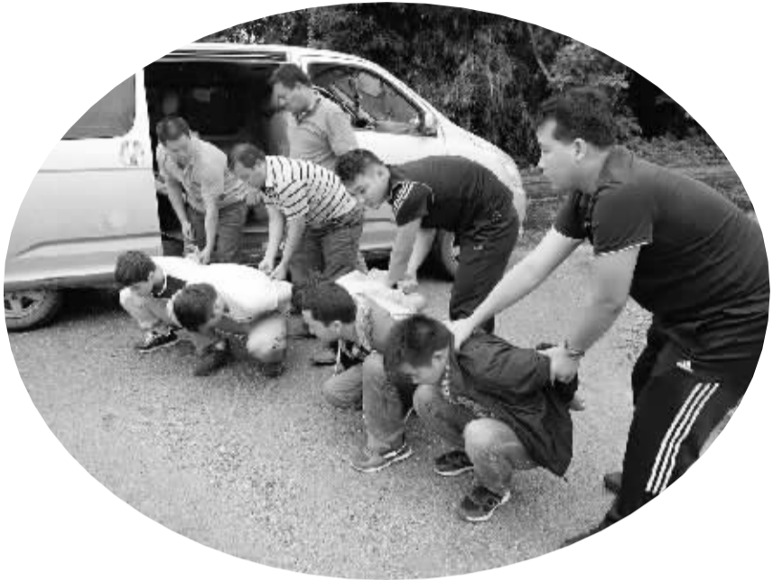
公安机关查获偷越国(边)境犯罪嫌疑人

1 月 18 日,记者从公安部获悉,在打击西南边境地区组织偷渡专案行动中,警方共破获组织、运送、偷越国(边)境案件 262 起,抓获涉嫌组织、策划、运送他人偷越国(边)境的犯罪嫌疑人 352 名,查获涉嫌偷越国(边)境犯罪嫌疑人 852 名。调查显示,境外“东伊运”组织是很多重大偷渡案的幕后操纵者,一些宗教极端分子在蛊惑煽动下寻求出境参加恐怖组织和所谓的“圣战”。一旦在偷渡过程中遇阻,则就地实施暴恐活动。如昆明“3·01”暴恐案件,实施者就是极端主义分子在云南欲偷渡受阻后,转为在国内实施恐怖袭击。