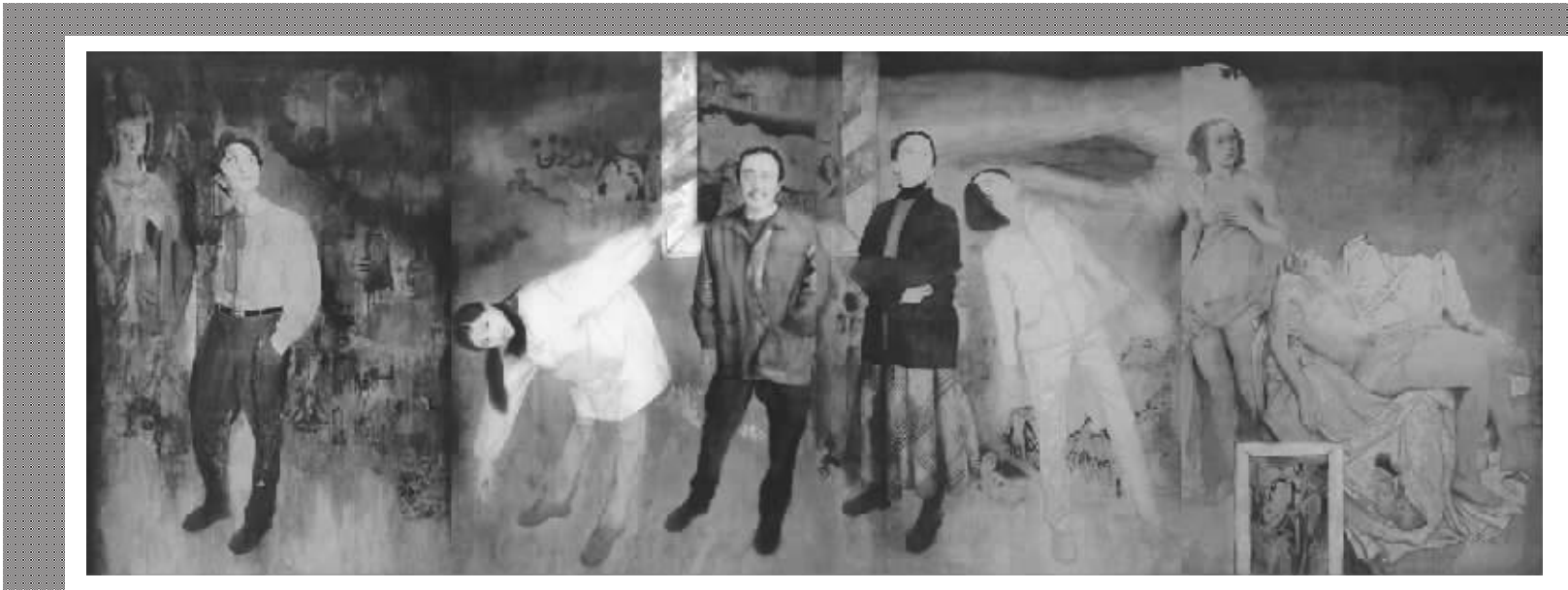
王颖生的代表作《踱步》