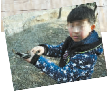
男孩取走被粘住的鸟