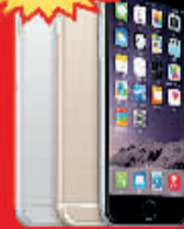
苹果 (iPhone 6 16GB)