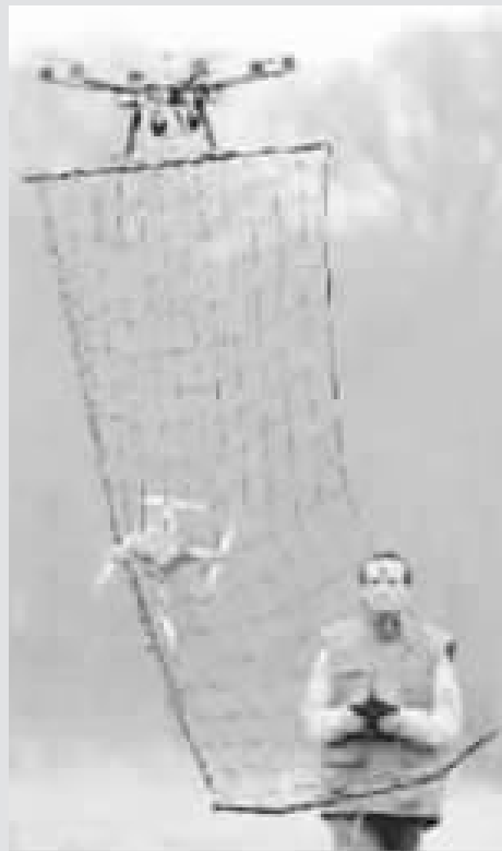
法国安全部门工作人员演示诱捕无人机。