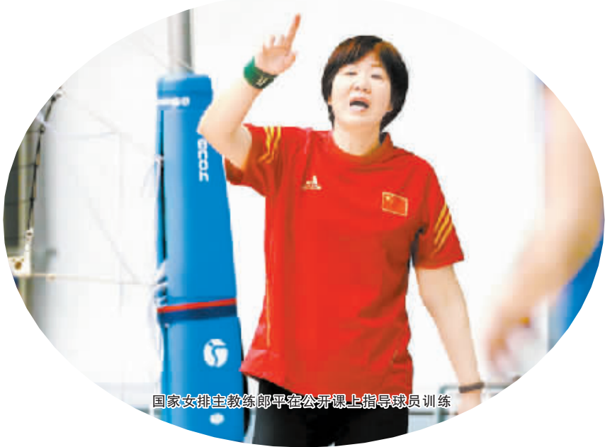
国家女排主教练郎平在公开课上指导球员训练

本报综合消息 3 月 4 日上午 9 时,郎平指挥的中国女排在京举行了媒体公开课,这是继 2014 至 2015 赛季联赛结束后短暂集中和春节放假归来后,中国女排人员最齐整的一次公开亮相,下一步全队将开赴南方进行大运动量训练,郎平准备动真格的了。