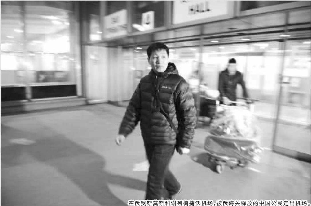
在俄罗斯莫斯科谢列梅捷沃机场，被俄海关释放的中国公民走出机场。

被扣留的34名中国公民3月7日已全部被释放。俄海关为何摆出把卤水错认为是冰毒的大乌龙？