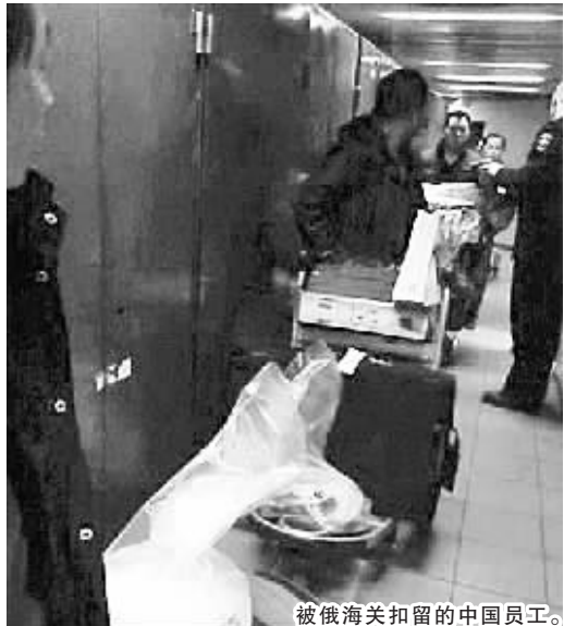
被俄海关扣留的中国员工。