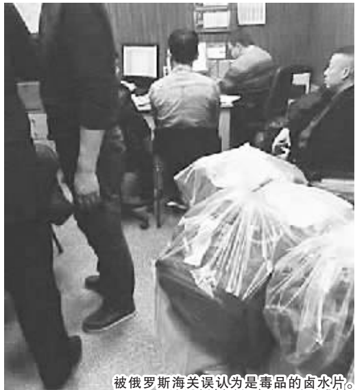
被俄罗斯海关误认为是毒品的卤水片。