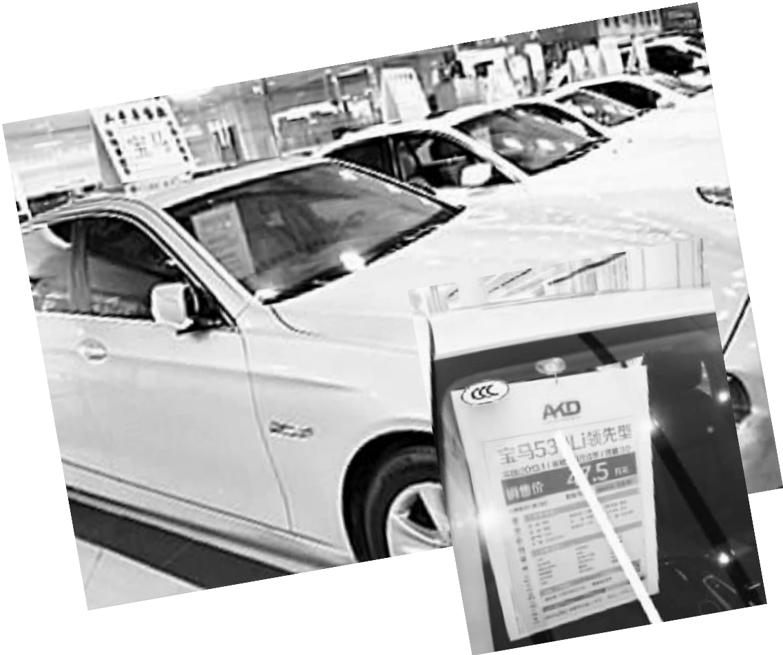
大车行中车的信息十分详细