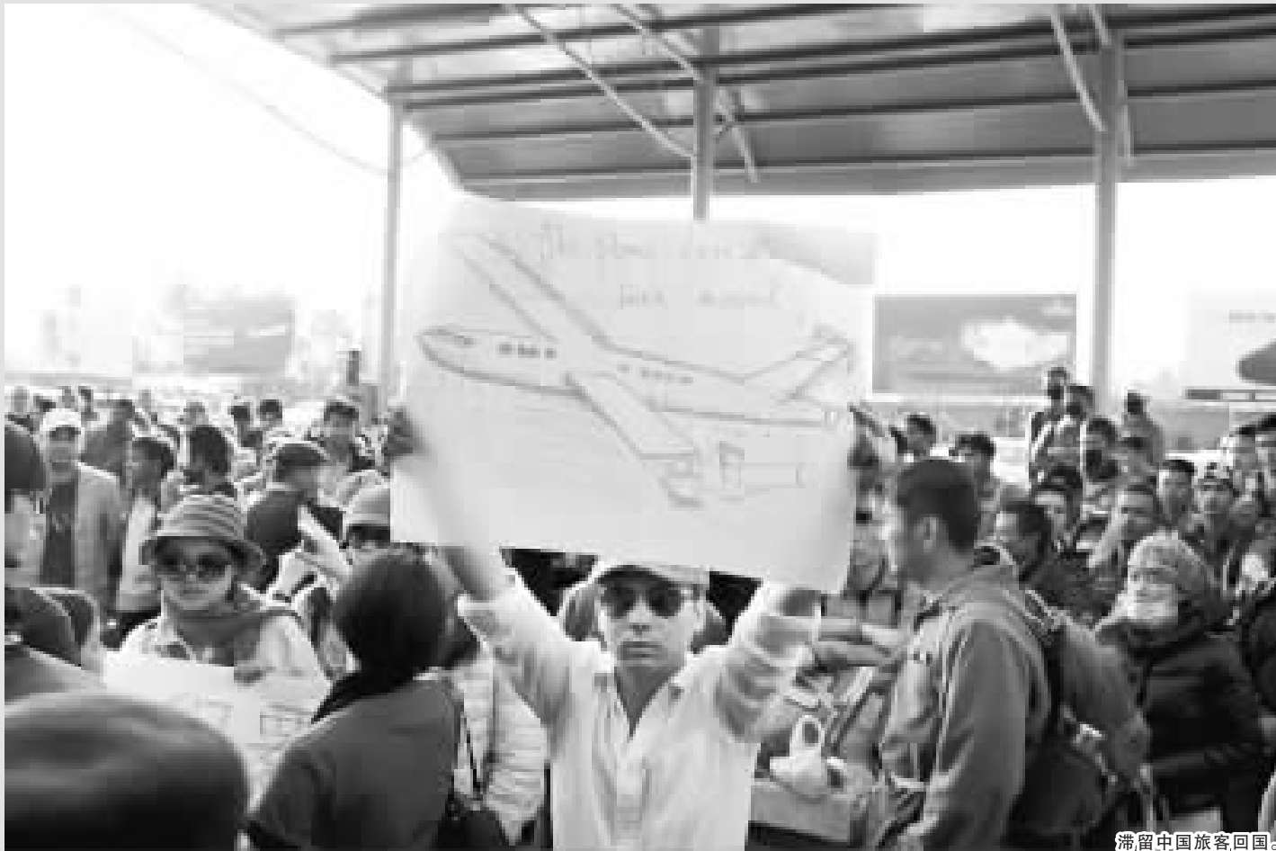
滞留中国旅客回国。