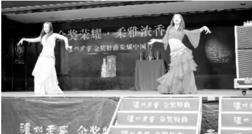
酒水销售下基层，深耕精神农村大市场。“八项规定”出台以来，我市酒水销售渠道逐级下沉，部分知名酒业也来到基层消费中间，开展宣传营销活动。图为“泸州老窖”在周口市街头开展营销宣传。