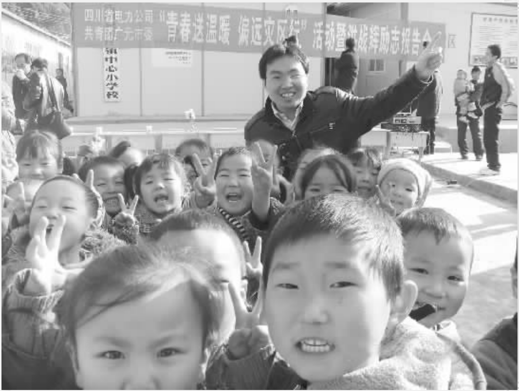
洪战辉与四川地震灾区的孩子们合影

洪战辉，1982 年出生，西华县东夏镇洪庄村人，先后就读于湖南怀化学院，中南大学。因带着捡来的妹妹艰难求学 12 年，2005 年，被评为感动中国十大人物之一，成为时代偶像。