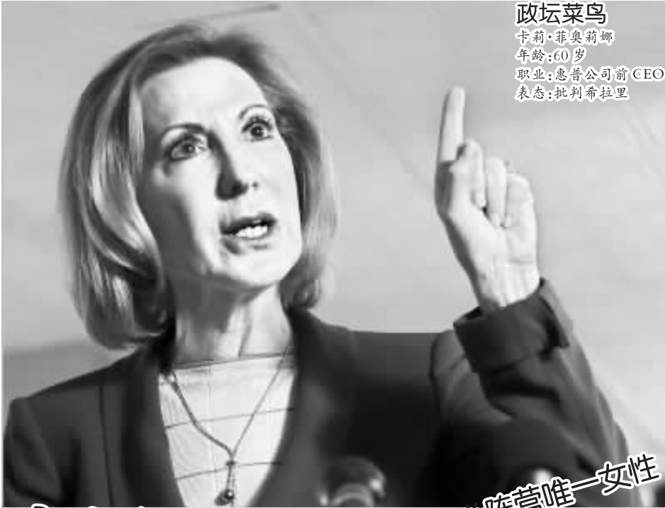
政坛菜鸟 卡莉·菲奥莉娜 年龄:60 岁 职业:惠普公司前 CEO 表态:批判希拉里