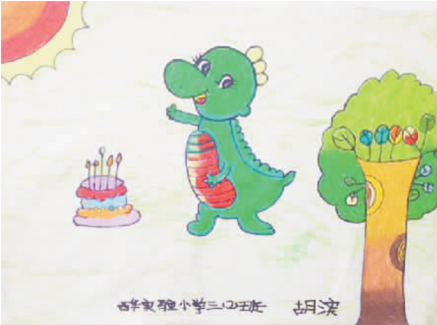
小恐龙过生日 小记者:胡滨 编号:155219 学校:西华县实验小学三(2)班

哈哈大笑,妈妈赶紧跑过来把我扶起来。可我并不灰心,爬起来继续滑。这次我慢慢地扶着墙滑了一圈,居然没有摔倒,我对自己更有信心了。刚有点小得意的时候,“咚”的一声,我又一屁股坐地上了,真疼!学滑冰怎么那样难呀?可是我依旧不放弃,又经过一段时间的训练,我终于可以独立滑行了。通过学滑冰,我懂得了一个道理:很多事看起来容易,做起来难,不过只要你不放弃,只要你能坚持,总会有收获的。