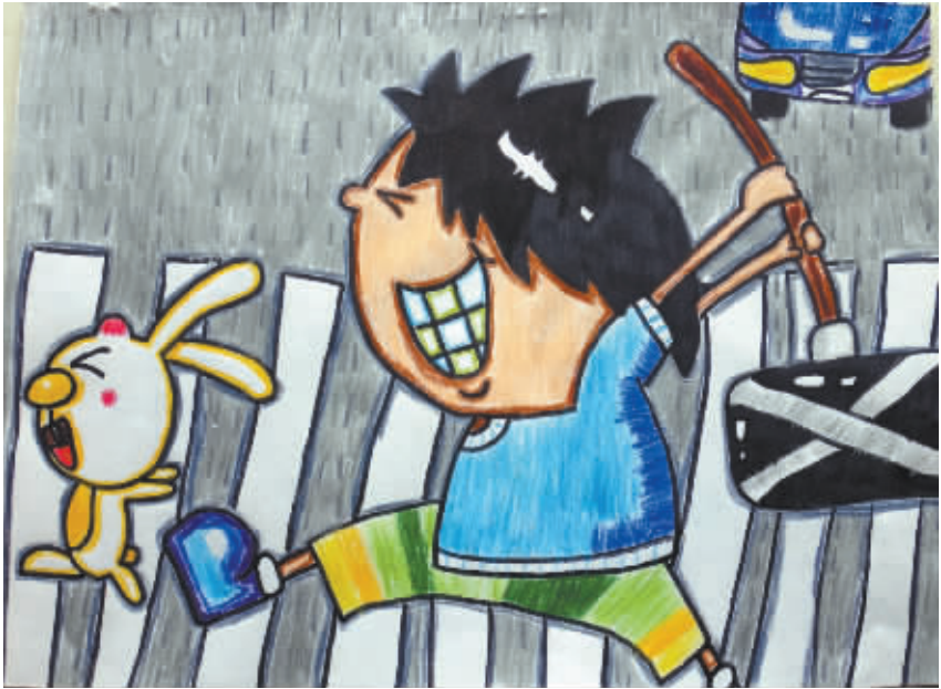
追逐 小记者:杨昀潇 编号:155052 学校:西华县明德小学三(4)班

妈妈的微笑是世界上最和煦的春风,妈妈的皱纹是风霜雨雪的刻痕,母亲的泪水和汗水是世界上最珍贵的钻石,正如一首歌里唱的:“世上只有妈妈好……”有一天临近放学的时候,突然,一道闪电划破天空,震耳欲聋的雷声一阵接着一阵,紧接着大雨倾泻而下。我发愁了:爸爸到外地学习了,妈妈又在工作,谁能给我送把伞呢?突然,教室窗外的雨帘中出现一个熟悉的身影,我仔细一看竟然是妈妈。我冲出去一头扑进妈妈的怀里。妈妈用冰冷的手抚摸着我的脸,说:“我来晚了吧?”我对妈妈说:“妈妈,我爱你!”